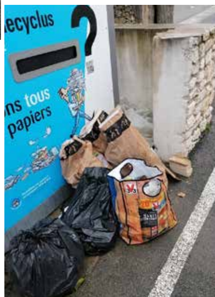
Déchets abandonnés dans le village...