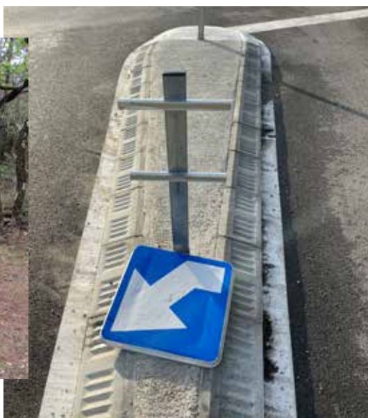
Dégradation de biens...