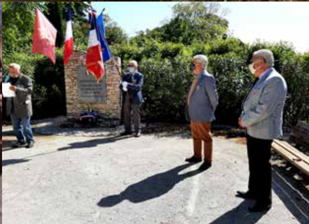
Le conseil municipal