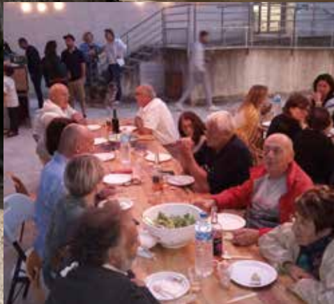
La solidarité à Sauzet